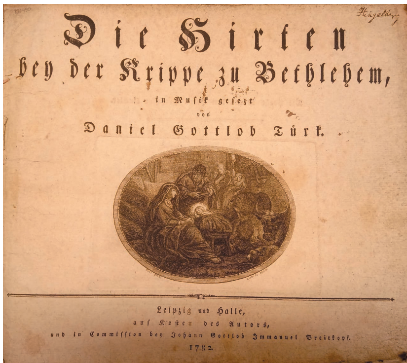
3. D. G. Türk, Die Hirten bey der Krippe zu Bethlehem, Leipzig; Halle 1782. Ze zbiorów PAN Biblioteki Gdańskiej, sygn. PAN BG Bibl. Joh. D. 8. Karta tytułowa z podpisem „Hingelberg”.